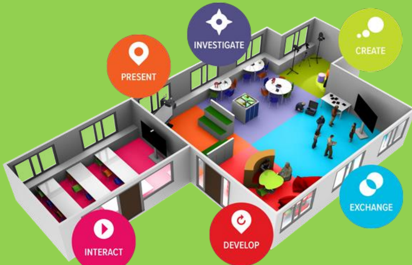
Funkcinių mokyklos erdvių pavyzdys (European Schoolnet, 2022)

Mokyklos ugdymo aplinkų kūrimo aspektai: